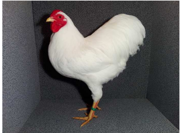
v 97 Enrico Berner

Die Frühjahrsversammlung ist am 29.3.2020 an gewohnter Stelle im Reichenbacher Vereinsheim. Bitte beteiligt euch alle an der Gruppenschau, um eure Tiere mit anderen vergleichen zu können und Trends sowie Erfahrungen auszutauschen. Bei einer größeren Anzahl an Vergleichstieren lässt sich besser erkennen, wo man mit meiner Zucht steht, als wenn man nur als einzelner auf einer kleinen Schau ausstellt. Die Bewertung ist professioneller und aussagekräftiger als bei einer Allgemeinschau. Das Tier und die Bewertungsnote ist doch die Grundlage für jede Diskussion vor dem Käfig. Auch deshalb hat der Preisrichter eine besonders sensible Rolle in unserem System. Er hat den größten Einfluss, den geforderten Tier-Typ zu positionieren. Er sorgt aber ab und zu auch für Verunsicherung, indem er Dinge sieht, die der Züchter nicht so nachvollziehen kann. Speziell für nachrückende Züchter, die sich an der Gruppenschau oder Leipzig orientieren. Dennoch sollte sich jeder Züchter oder Preisrichter immer hinterfragen, ob er den richtigen Blickwinkel auf die Zucht hat. Daher nutzt die Chance so lange es noch eine Gruppenschau in unserer Nähe gibt. Werbt auch mit den sogenannten Vorteilen sich höheren Wettbewerben zu stellen und um Mitglieder zu gewinnen.