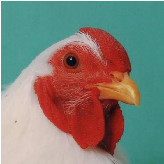
Kopfstudie Hannover 2008 Nr. 10205

Anbei einige Impressionen seiner zur Verfügung gestellten Unterlagen.