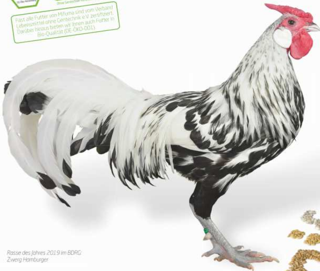
Rasse des Jahres 2019 im BDRG: Zwerg Hamburger