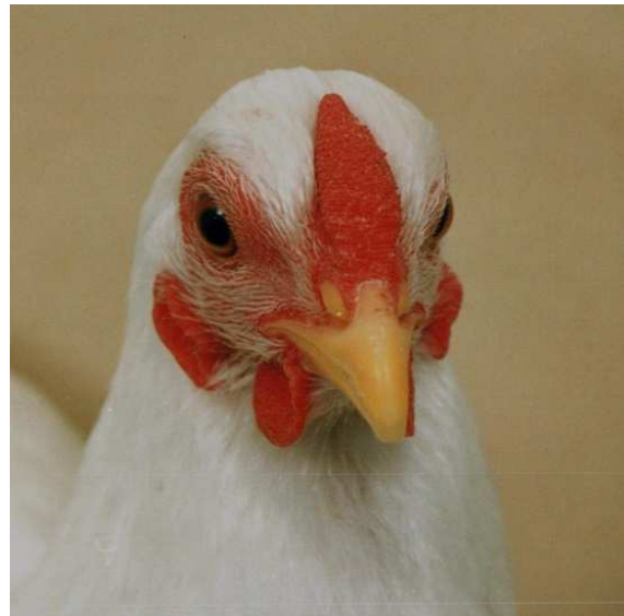
Kopfstudie Hannover 1992 Nr. 14332 sg E